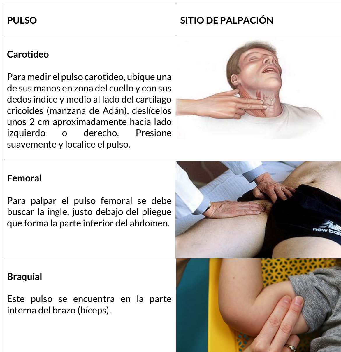
Tabla 1: Sitios comunes de palpación de pulso.